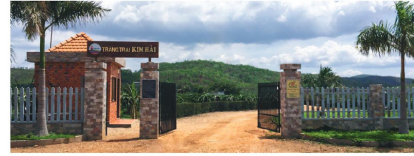
Kim Hai Dragon Fruit Farm.